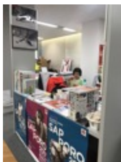
連盟事務局の様子